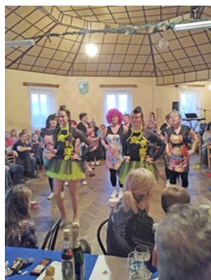
Nouzov, oslava MDŽ