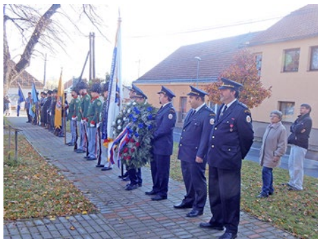
28. říjen 2019