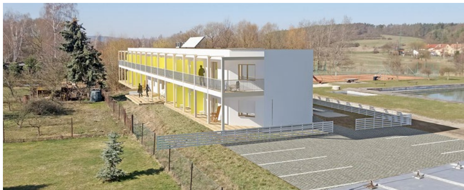
Dům klidného stáří

Předpokládaný rozpočtový přebytek bude v následujících letech využit k realizaci finančně velmi náročných investic (Dům klidného stáří, rekonstrukce mateřské školy a školní jídelny včetně vestavby mateřského centra, velké sportovní hřiště, rekonstrukce sokolovny).