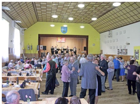
Setkání s písničkou