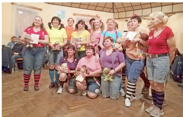
Spolek Nouzovské ženy