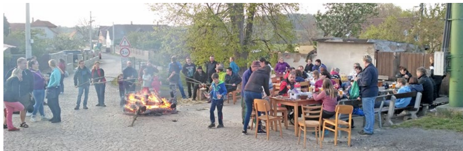
Pálení čarodějnic Nouzov