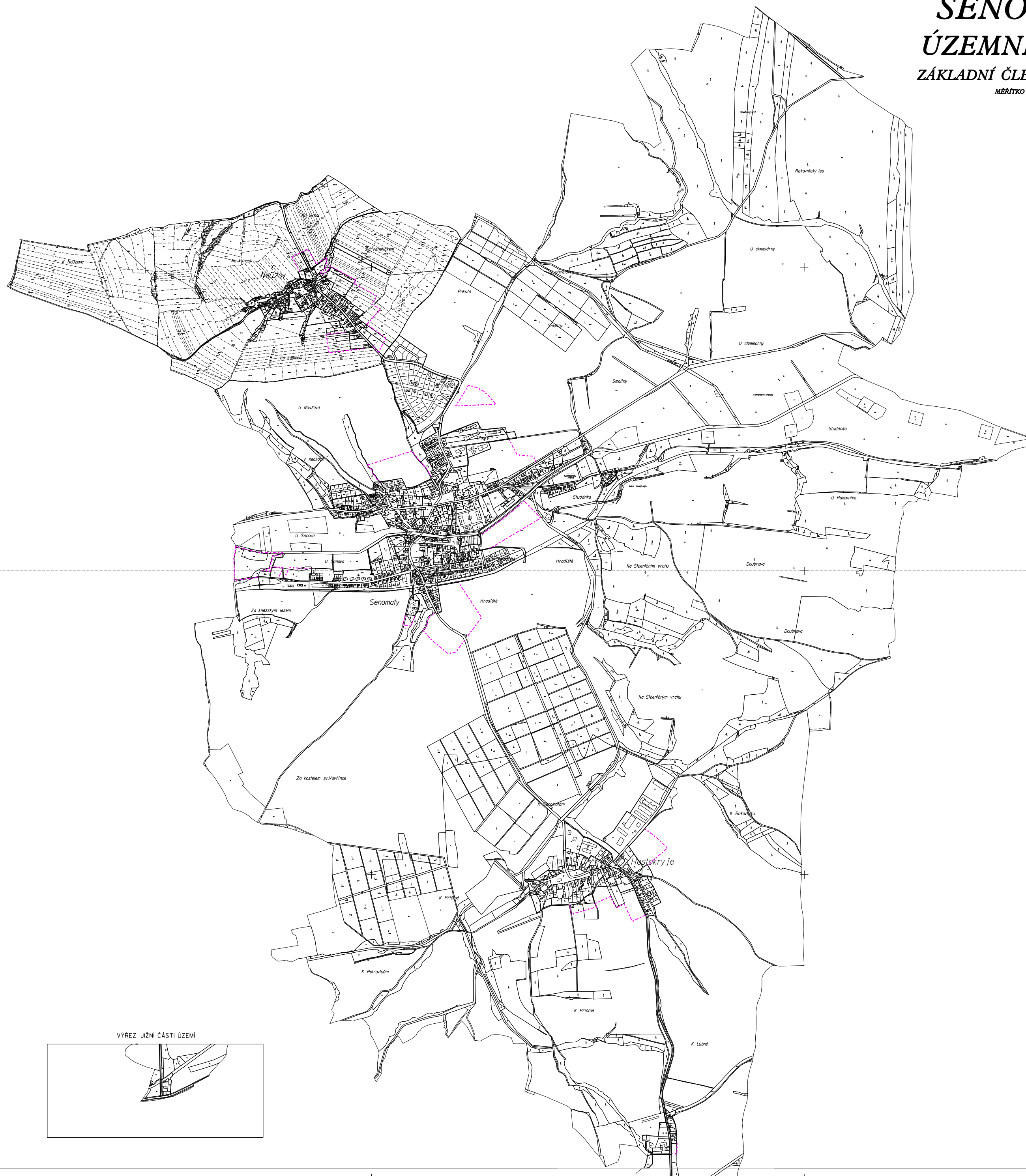
VÝREZ JIŽNÍ ČÁSTI ÚZEMÍ

— HŘANICE ZASTAVĚNÉHO ÚZEMÍ - - - HŘANICE ZASTAVITELNÝCH PLOCH